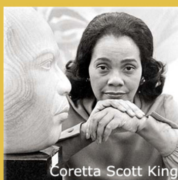
Coretta Scott King