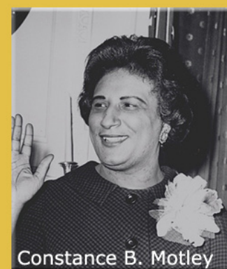
Constance B. Motley