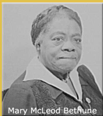
Mary McLeod Bethune